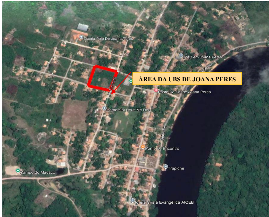
Figura 1- Localização da Unidade Básica de Saúde de Joana Peres, Zona Rural do município de Baião/PA.