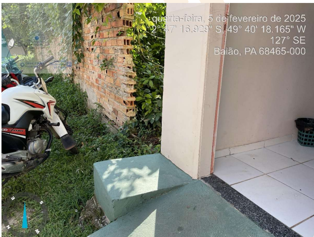
Imagem 05- Interseção das salas existentes e salas a serem ampliadas