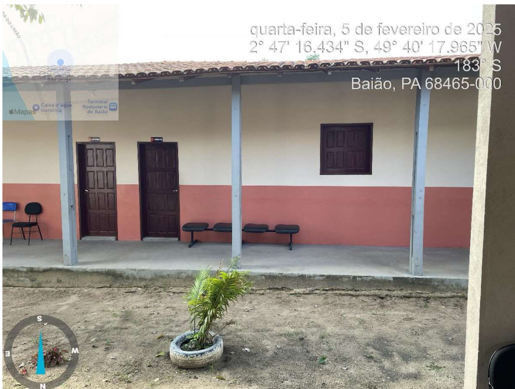
Imagem 04- Vistas das salas do prédio