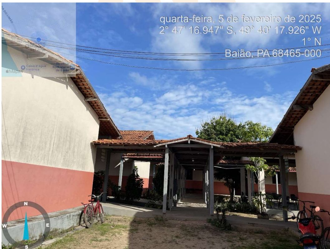
Imagem 03- Corredores a serem conectados e padronizados