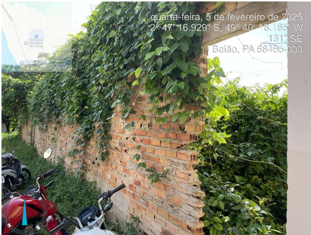
Imagem 02- Lateral das salas a serem ampliadas