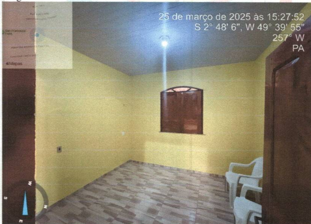
Imagem 07 – quarto 1