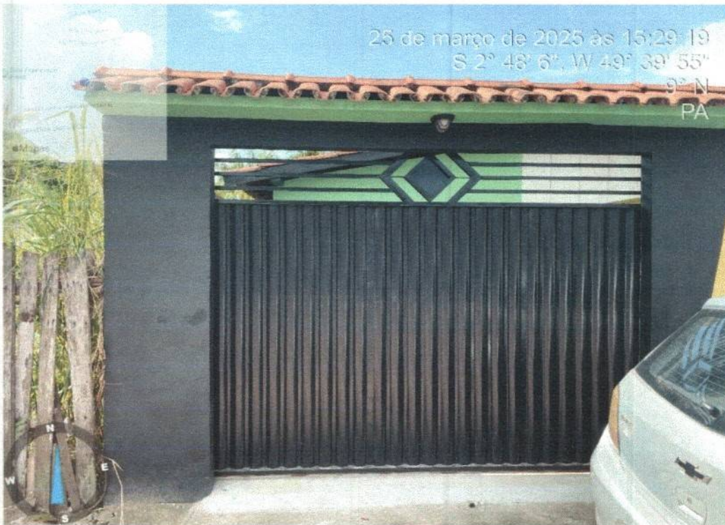
Imagem 02- Entrada de Carros