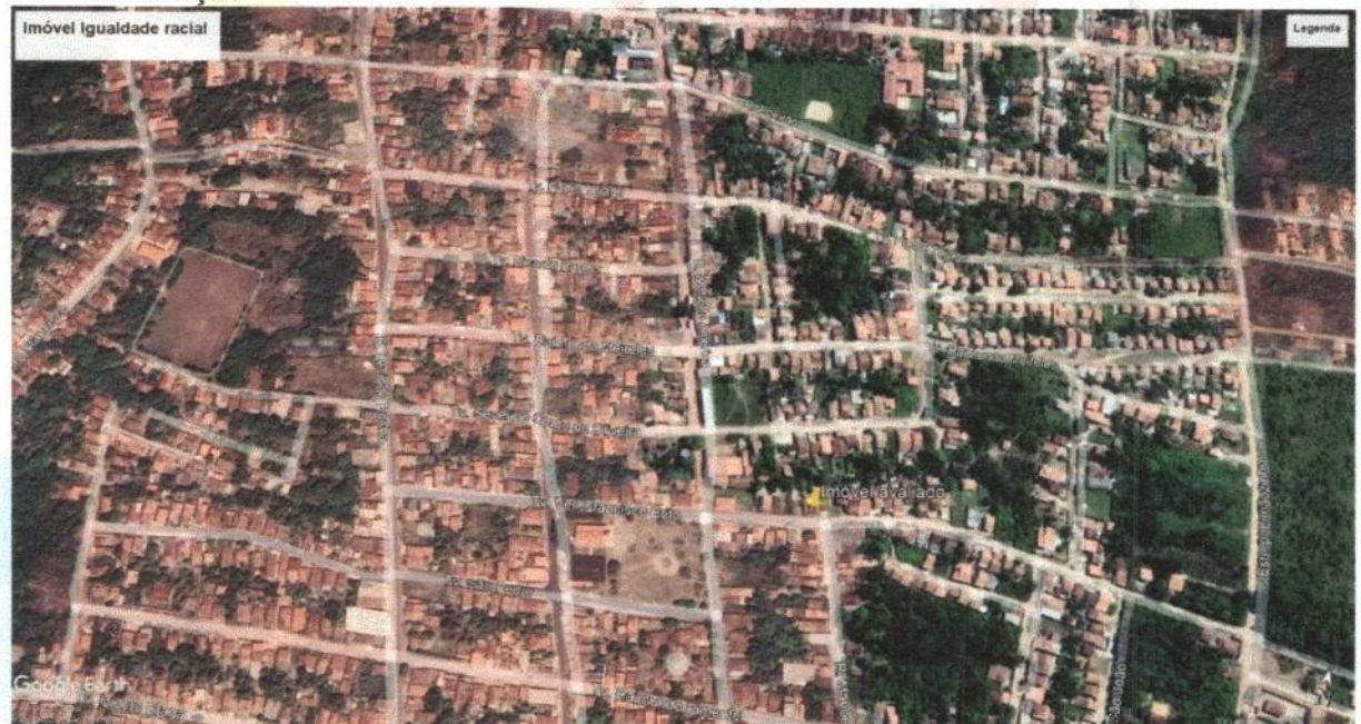
Imagem 01- Localização imóvel avaliado