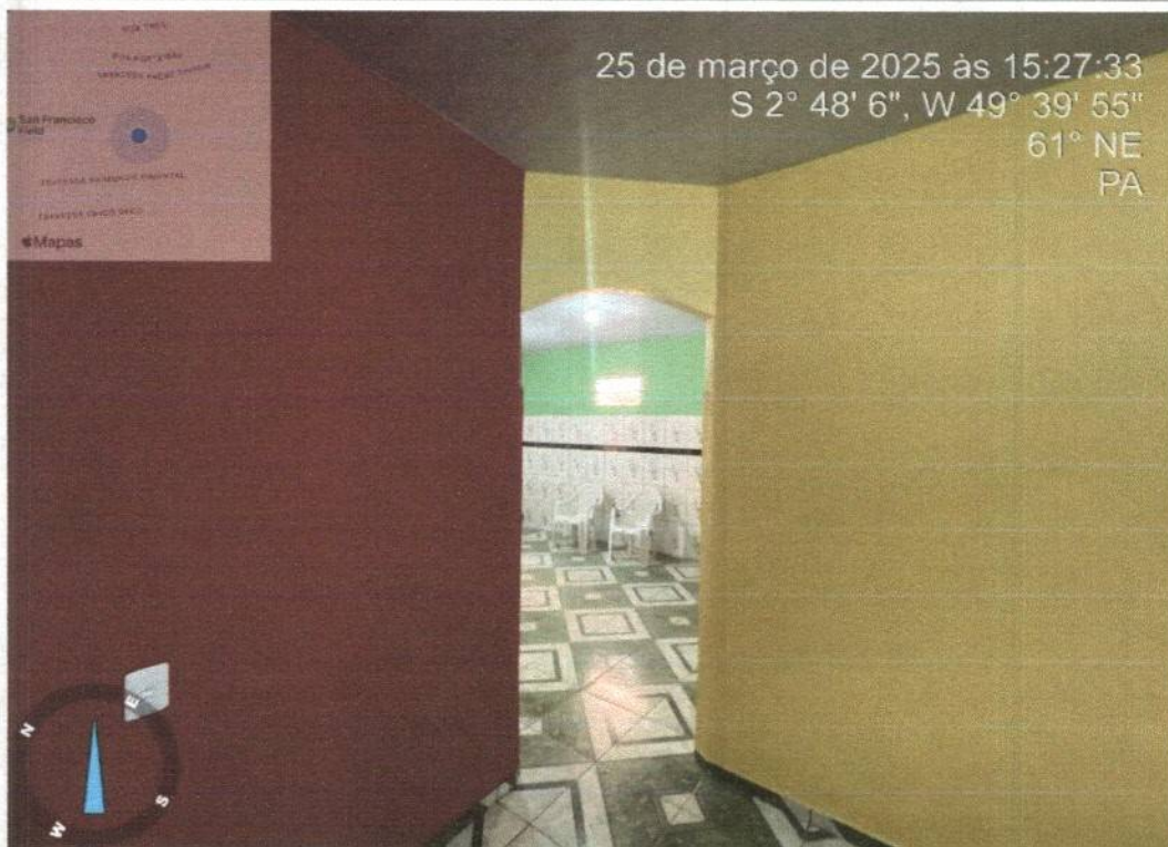
Imagem 06- vista interna