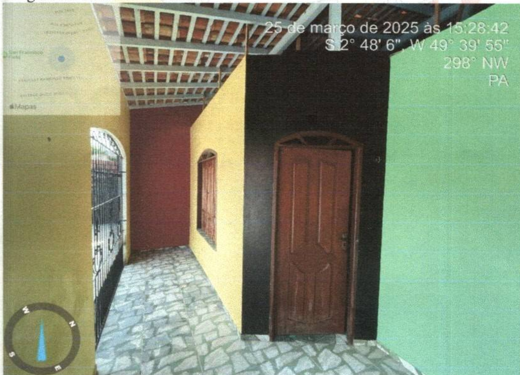
Imagem 03- pátio