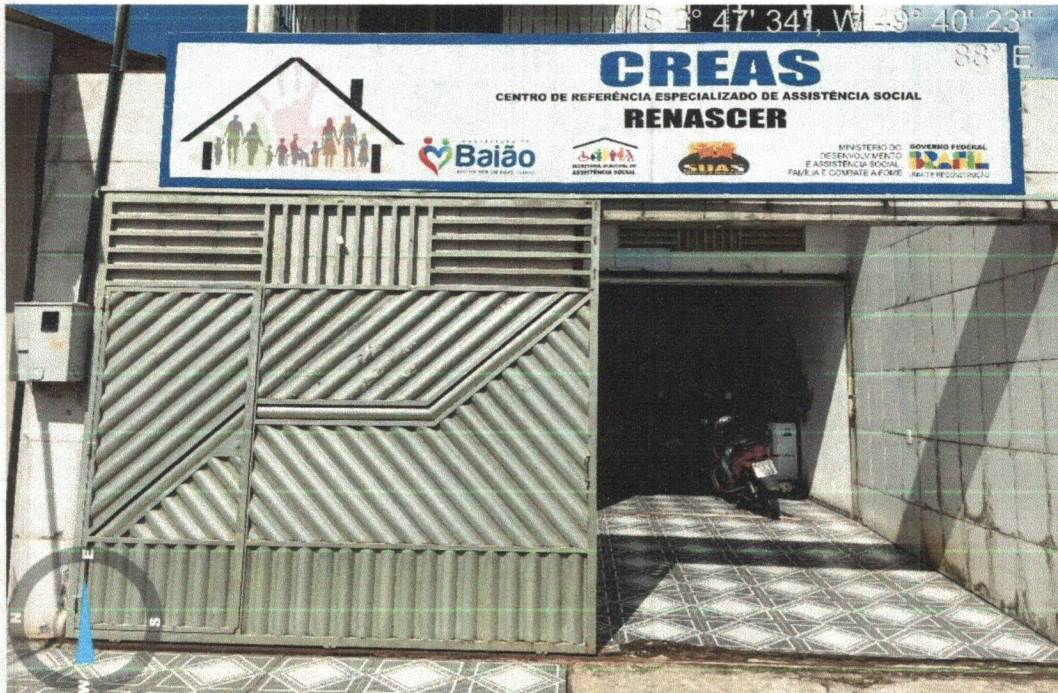
Imagem 02- Entrada do prédio