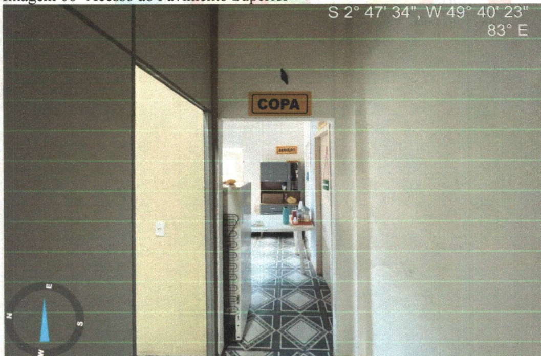
Imagem 07 – vista copa e corredor