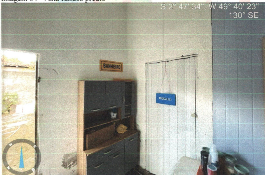
Imagem 05- Vista cozinha e banheiro