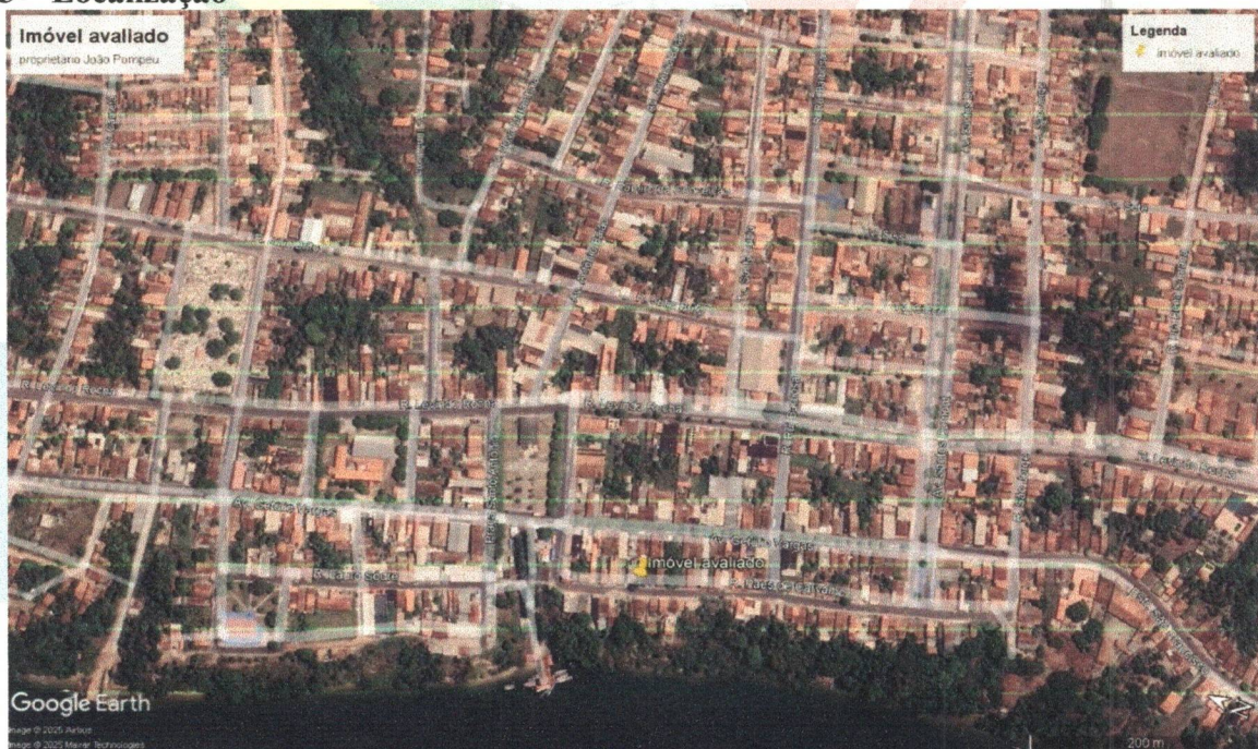
Imagem 01- Localização imóvel avaliado