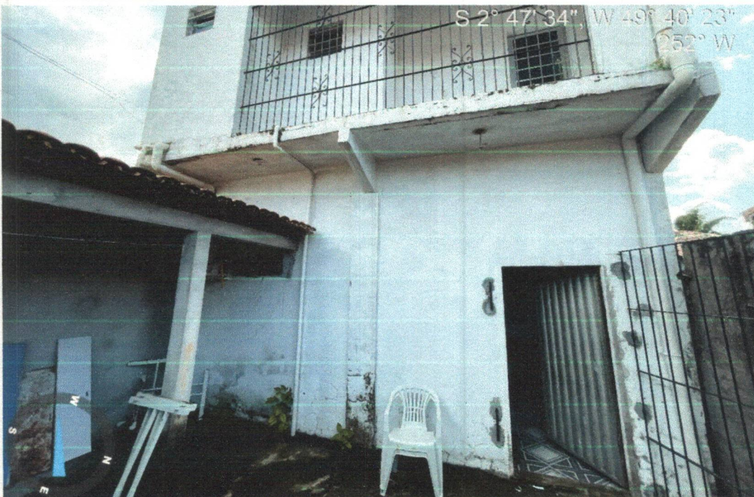
Imagem 04- Vista fundos prédio